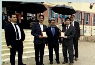
Öğretmenler Arası Satranç Turnuvası 1. Kırkmağara