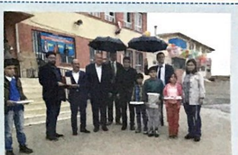
4. Sınıflar Arası Bilgi Yarışması 3. Kırkmağara