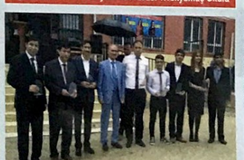
Etkinliklere Katılan Okul Müdürlerine plaket takdim edildi