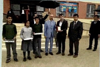
7. Sınıflar Arası Bilgi Yarışması 1. Kırkmağara

Bu etkinliklere 450 sporcu ve yarışmacı katıldı. Etkinliklerde emeği geçen, yarışan, destek veren herkese ve ödül törenine bu yıl ev sahipliği yapan Kaplan İlk/Ortaokulu yöneticileri ve öğretmenlerine teşekkür ediyoruz.