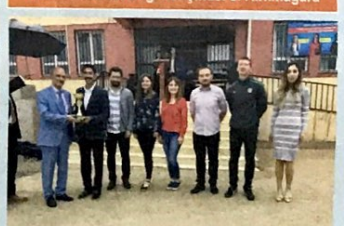
Öğretmenler Arası Voleybol Turnuvası 1. Tekyamaç Okulu