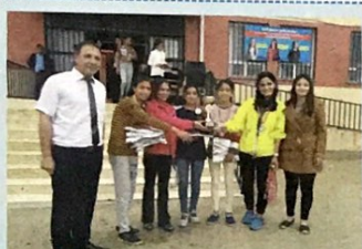
Kızlar Arası Futbol Turnuvası 2. Çiftkemere Okulu